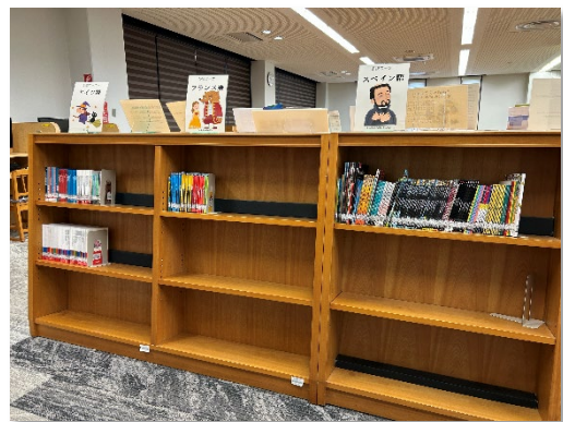
英語多読コーナー（本館2階）