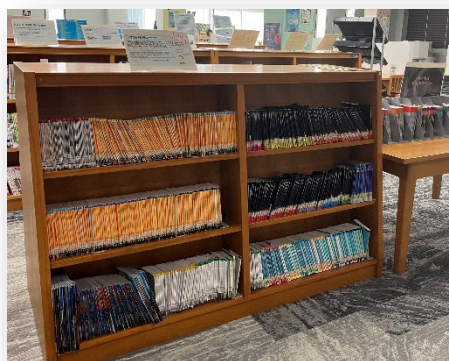
英語多読コーナー（本館2階）

多読では、選んだ本を「辞書を引かず」「わからないところは飛ばし」ながら読んでみてください。もし辞書を引かないと何の話かわからない、飛ばす場所が多すぎて筋を追っていけないのであれば、その本は自分の英語力に合っていないのです。一番大切なことは、やさしくすらすら読める本を選ぶことなので、「自分に合わない、おもしろくない」と思ったら、あっさり別の本に切り替えましょう。1冊ずつとても薄い本がほとんどなので、自分が読める、面白いと思った本を、できるだけ定期的に継続して読み、読んだ総語数を積み上げていくようにすると、どんどん英語力がついていきます。ここで、先輩の体験談を紹介します。