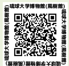
琉球大学博物館(風樹館)