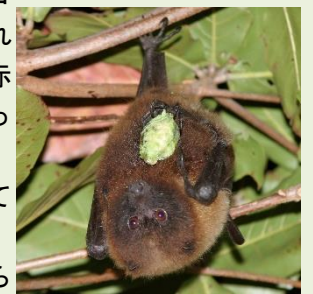
3 オリイオオコウモリ

これからの季節は、ハブの活動が活発になるから、学内では草むらに注意。マングース、ハブ、アカマタ、ガラスヘビ、アマミタカチホヘビなどがいるんだって。