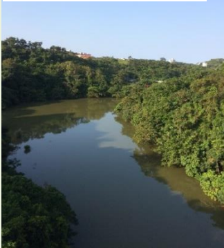
6 千原池(人工池) 水は農地やトイレで使用

佐々木先生は、「キャンパス内には鳥がたくさんいて、カワウ、ミサゴなどがいるよ。千原池周辺にはフクロウがいて、夜になるとアオバズクは“ホーホーホー”と鳴いて、リュウキュウコノハズクは“コホ、コホ”と鳴くから、球陽橋の上から聞いてみて。」と教えてくれたよ。フクロウがいるなんてびっくりだね。これからの季節は真っ赤な色のアカショウビンも渡り鳥として琉球大学へやってくるんだって。