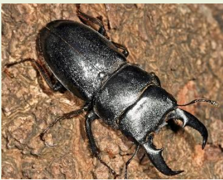
5 オキナワヒラタクワガタ

第1回は、琉球大学千原キャンパスの自然について、琉球大学博物館(風樹館)の佐々木健志先生に教えてもらったよ。琉球大学博物館(風樹館)は、自然観察の授業などで人気があるよ。沖縄の自然や歴史・文化に関する収蔵品が17万点、特に自然の展示に定評があって無料で誰でも見学できるから、一度見に行ってみてね。