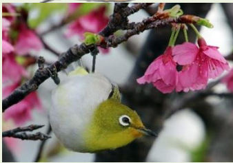
4 リュウキュウメジロ