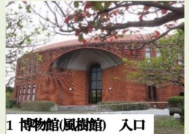
1 博物館(風樹館) 入口

毎年好評の館内コラムも今年度で7年目。今年度は「あなたの知らない琉球大学の秘密」というテーマで、自然、歴史、文化の話題を隔月でお届けします。